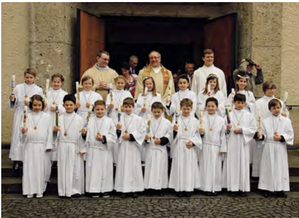
Selige Gesichter nach der Erstkommunion in Schondorf