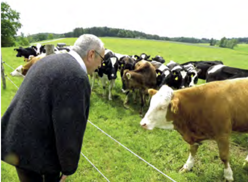
Meine Schwestern, meine Brüder...