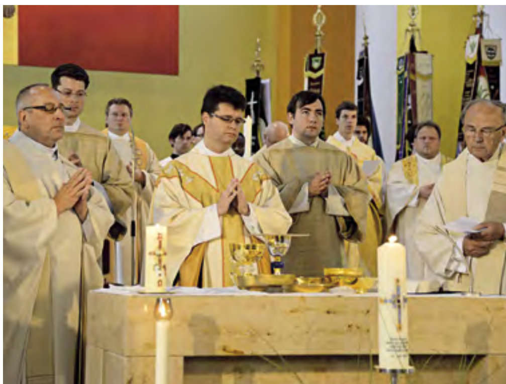
Sanctus, Sanctus, Sanctus – Primizgottesdienst in Heilig Kreuz