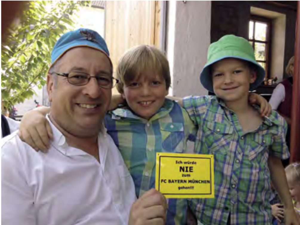
Endlich das passende Türschild – der unverbesserliche BVB-Fan bekommt, was seiner Seele frommt.