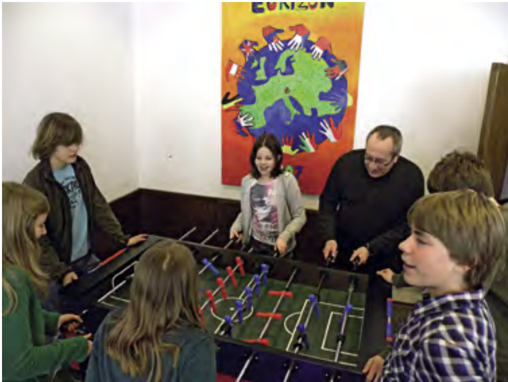
Firmwochenende in Benediktbeuern: Der Hl. Geist macht mobil, bei Arbeit, Sport und Spiel!