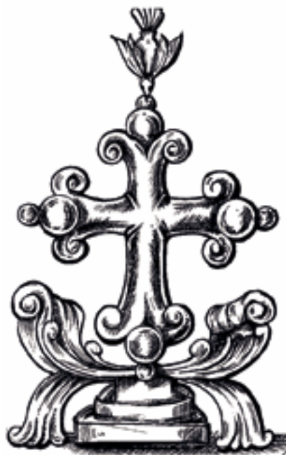
Kreuz der Thomas-Christen

ich die Schule. Später schloss ich mich der Ordensgemeinschaft der „Little Flower Congregation“ (Gemeinschaft der hl. Theresia vom Kinde Jesu) an. Diese Gemeinschaft wurde in Indien gegründet. Schon seit meiner frühesten Kindheit hatte ich den Wunsch, Priester zu werden. Mein Philosophie- und Theologiestudium habe ich in Indien abgeschlossen. Am 15. Februar 1990 wurde ich zum Priester geweiht. Danach war ich in unserem kleinen Priesterseminar in der Missionsdiözese