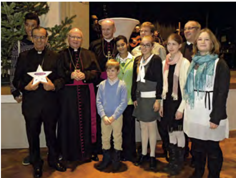
Auftakt zur Adveniat- Aktion in Augsburg – in den Hauptrollen die Schondorfer Ministranten mit Weihbischof Chávez von San Salvador