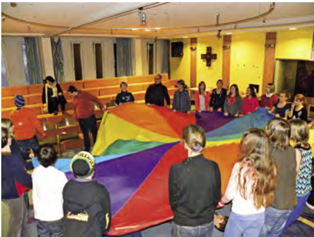
Auf dem Weg zur Firmung schließen wir die Lücken – gemeinsam schaffen wir's!