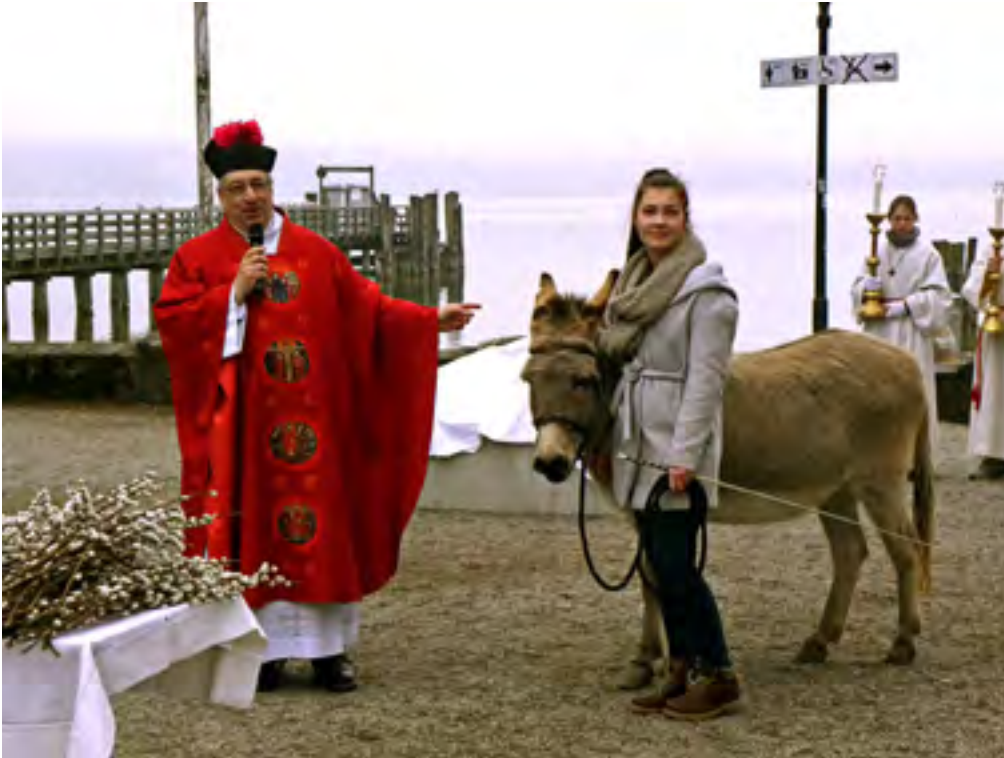
Palmsonntag am See – ein Palmesel (rechts) ist auch dabei.