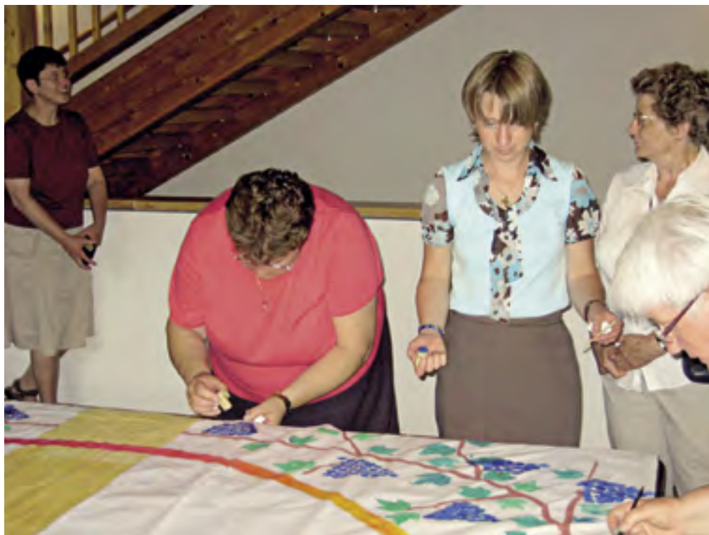
Gemeinschaftsarbeit – ein neues Altartuch für Mariä Heimsuchung