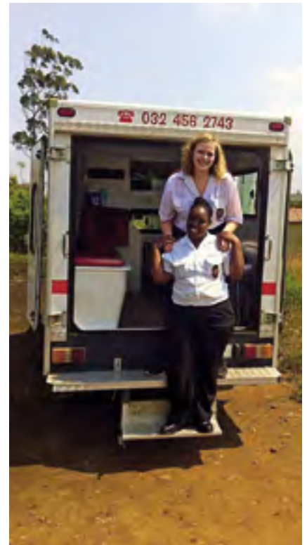
Ankunft in Mandeni