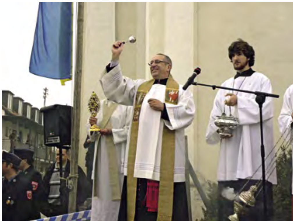
Segen für Ross und Reiter – Leonhardritt in Utting